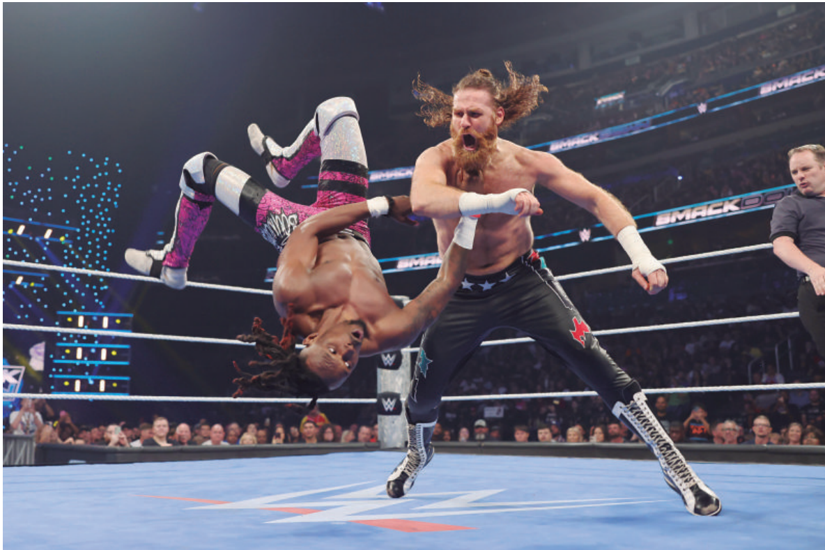
Fãs portugueses pagaram entre 55 e 995 euros para assistir aos golpes espetaculares das estrelas da WWE.

Não fizeram manchetes, nem foram destaque de última hora. Mas há histórias que passam pelas entrelinhas da atualidade e merecem muito ser contadas.