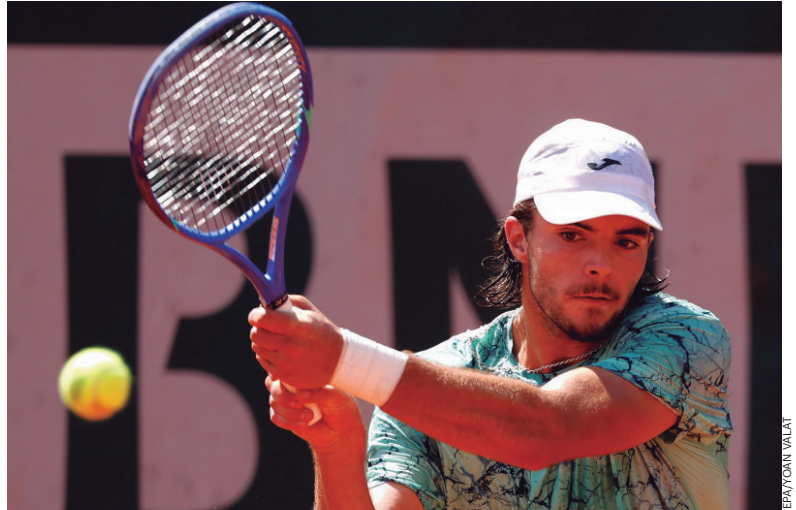
Número 2 português venceu o francês Jan-Lennard Struff por 3-0.

Assumir fragilidades passou a ser um risco que ninguém vai querer enfrentar. Qualquer reconhecimento de fracasso pode ser um sinal de fraqueza. Qualquer palavra sincera pode gerar contestação.”