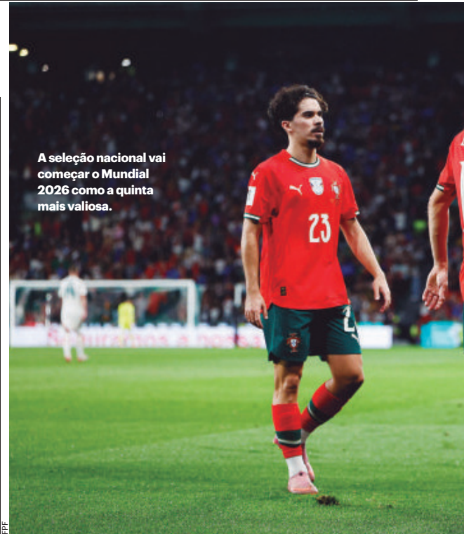
A seleção nacional vai começar o Mundial 2026 como a quinta mais valiosa.

A rainha dos milhões é a França, campeã mundial de 1998 e 2018, que está cotada em 1,47